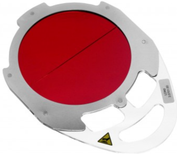
Filtr czerwony - parametry światła